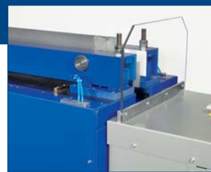
Эргономичное положение нагревательного элемента для его очистки

Машина уже в базовой комплектации располагает управлением Siemens SPS S7 с 5,7" графическим дисплеем для обслуживания машины. В ясной структуре меню оператор может получить необходимые для сварки усилия, время и температуру. Установка давления сварки осуществляется с помощью регулируемого пропорционального клапана. Опционно машина может быть оснащена базой данных, которая, на основе параметров DVS после ввода материала, толщины и длины листа автоматически устанавливает необходимые для сварки время, усилия и температуры, устанавливает и использует эти величины для соответствующего сварочного процесса. В пункте меню 'Нарушение' ясно отображаются все