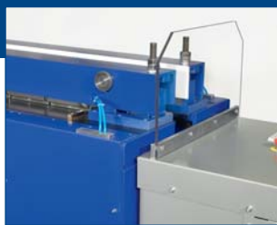
Нижняя позиция для опции регулируемых прижимных балок