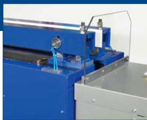
Верхняя позиция для опции регулируемых прижимных балок